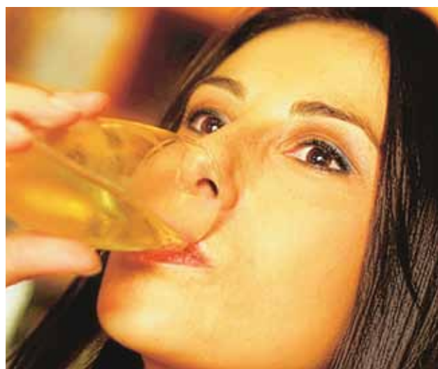
Una introducción temprana podría llevar a problemas con la bebida en la adolescencia, advierten investigadores.

Los investigadores también hallaron que 40 por ciento de las madres creían que no permitir a sus hijos probar el