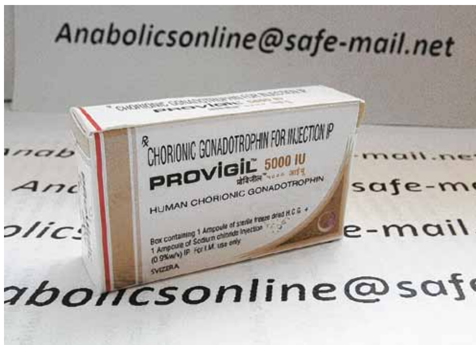
Muchos triunfadores dicen que la fórmula de su éxito se debe a esta pastilla. Y aunque saben que puede tener efectos en su salud a largo plazo, no dejarían de tomarla. Los médicos advierten que puede ser perjudicial en aquellos pacientes sanos que sólo lo utilizan para ser más vitales y mantenerse despiertos.

Para chequear los resultados en la práctica, ABC News le