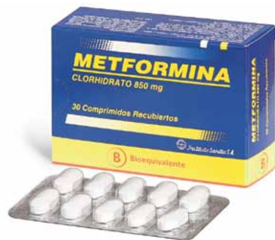
Un nuevo estudio suizo y estadounidense indica que el uso a largo plazo de la metformina, un popular fármaco para la diabetes, podría reducir el riesgo de desarrollar cáncer de páncreas, al menos entre las mujeres.

Para explorar el potencial protector de la metformina contra el cáncer de páncreas, el equipo estudió información sobre las recetas de fármacos, de los diagnósticos, de las hospitalizaciones y de las muertes que había sido recolectada por la “Base de datos de investigación sobre prácticas generales” británica. Los datos también incluyeron información demográfica significativa, como el