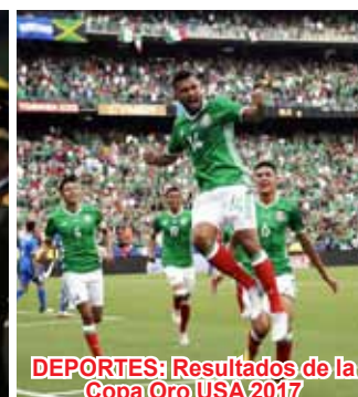
DEPORTES: Resultados de la Copa Oro USA 2017