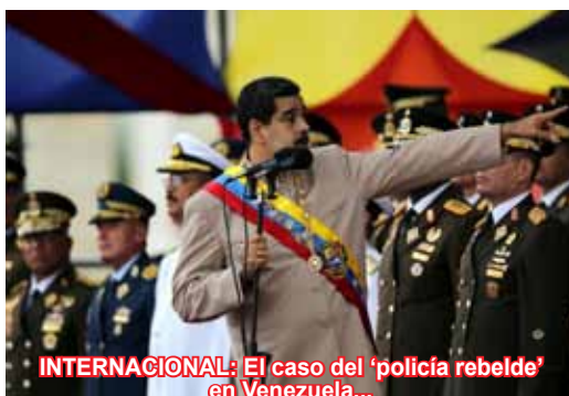
INTERNACIONAL: El caso del 'policia rebelde' en Venezuela...