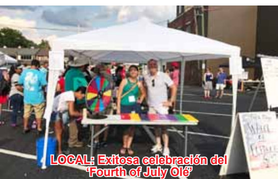
LOCAL: Exitosa celebración del 'Fourth of July Olé'