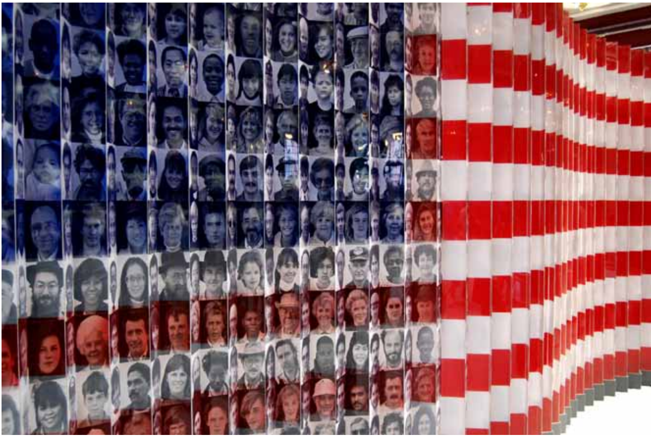
Memorandos internos del DHS, uno firmado por el secretario Kelly y otro por el jefe de la unidad de arrestos de ICE, confirman que el blanco del gobierno de Trump son los 11 millones de sin papeles.