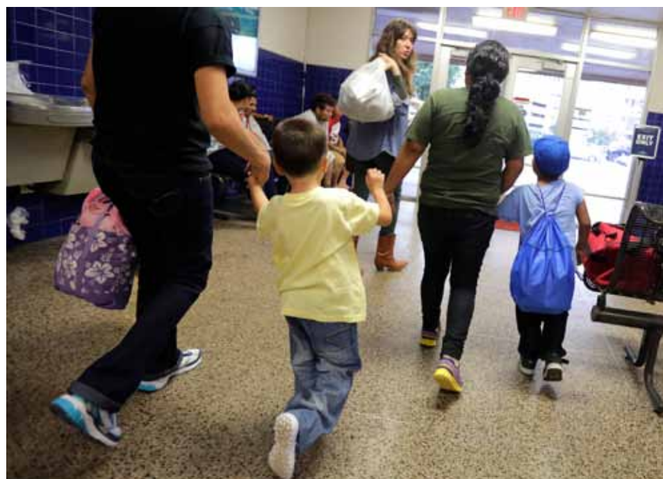
El secretario del Departamento de Seguridad Nacional (DHS), John Kelly, anunció que tenían previsto aplicar en algún momento esta iniciativa el 22 de febrero en memorandos que mostraron el reglamento para implementar las acciones ejecutivas migratorias del presidente Donald Trump.

Esto confirma la advertencia lanzada en febrero por el secretario del Departamento de Seguridad Nacional, John Kelly.